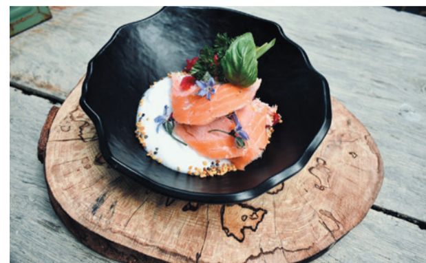
Warme gerookte zalm | rode zuurkool | witte wijnschuim | borage