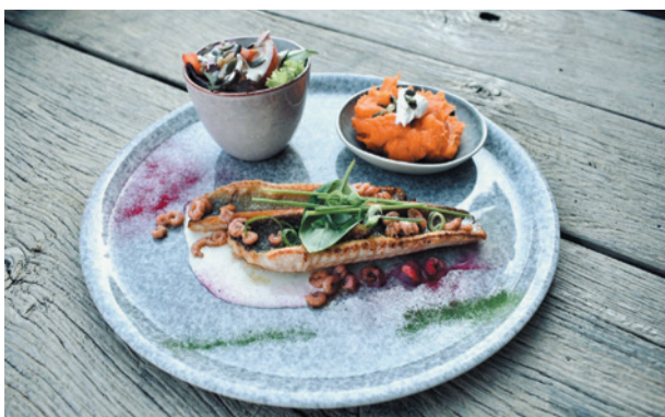
Pieterman | Hollandse garnalen | vieux-roomsausje